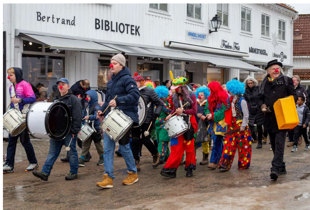
Klovneparade og folkefest i sentrum