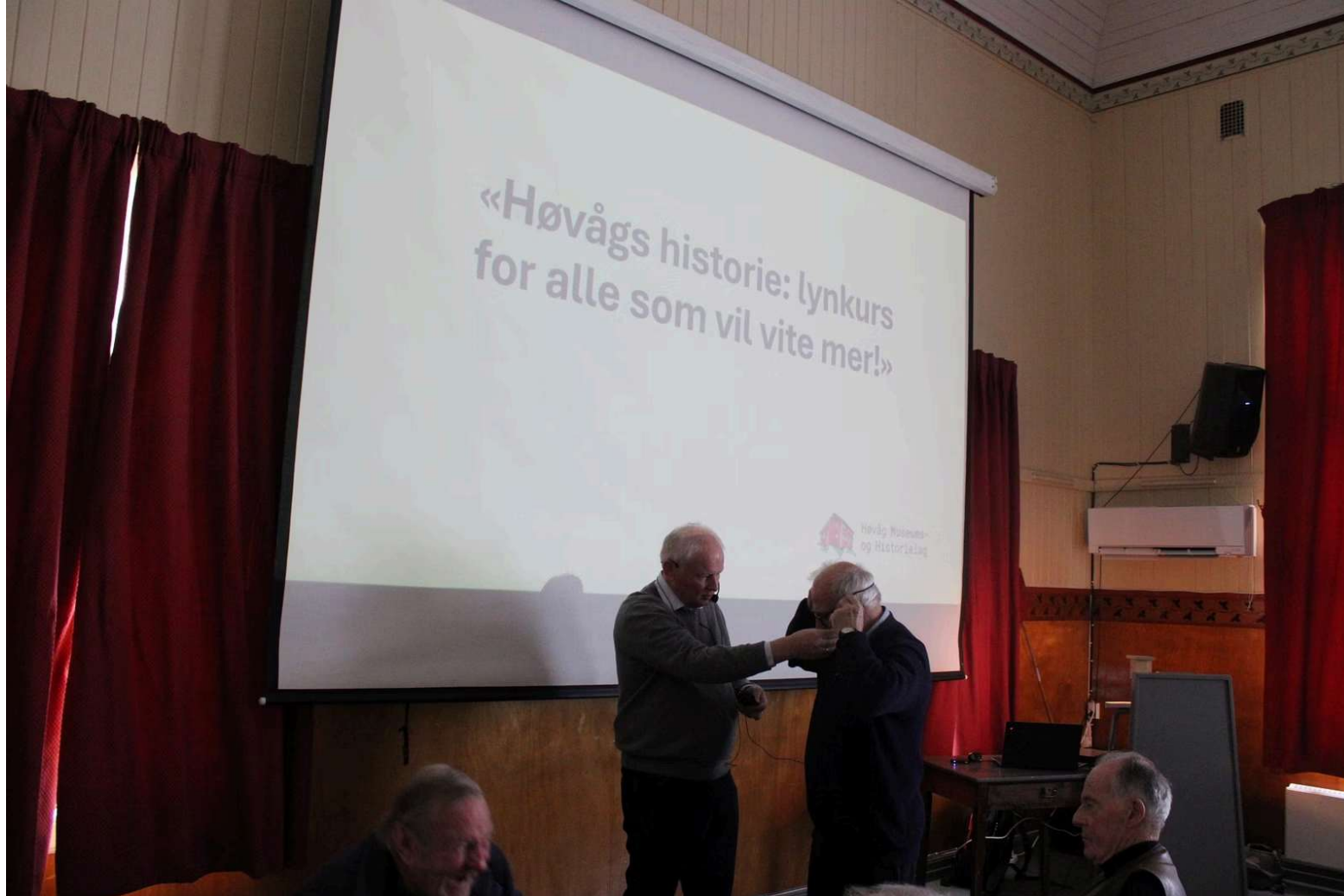
Første i historien: For aller første gang avholdt Høvåg Museums- og Historielag lynkurs.