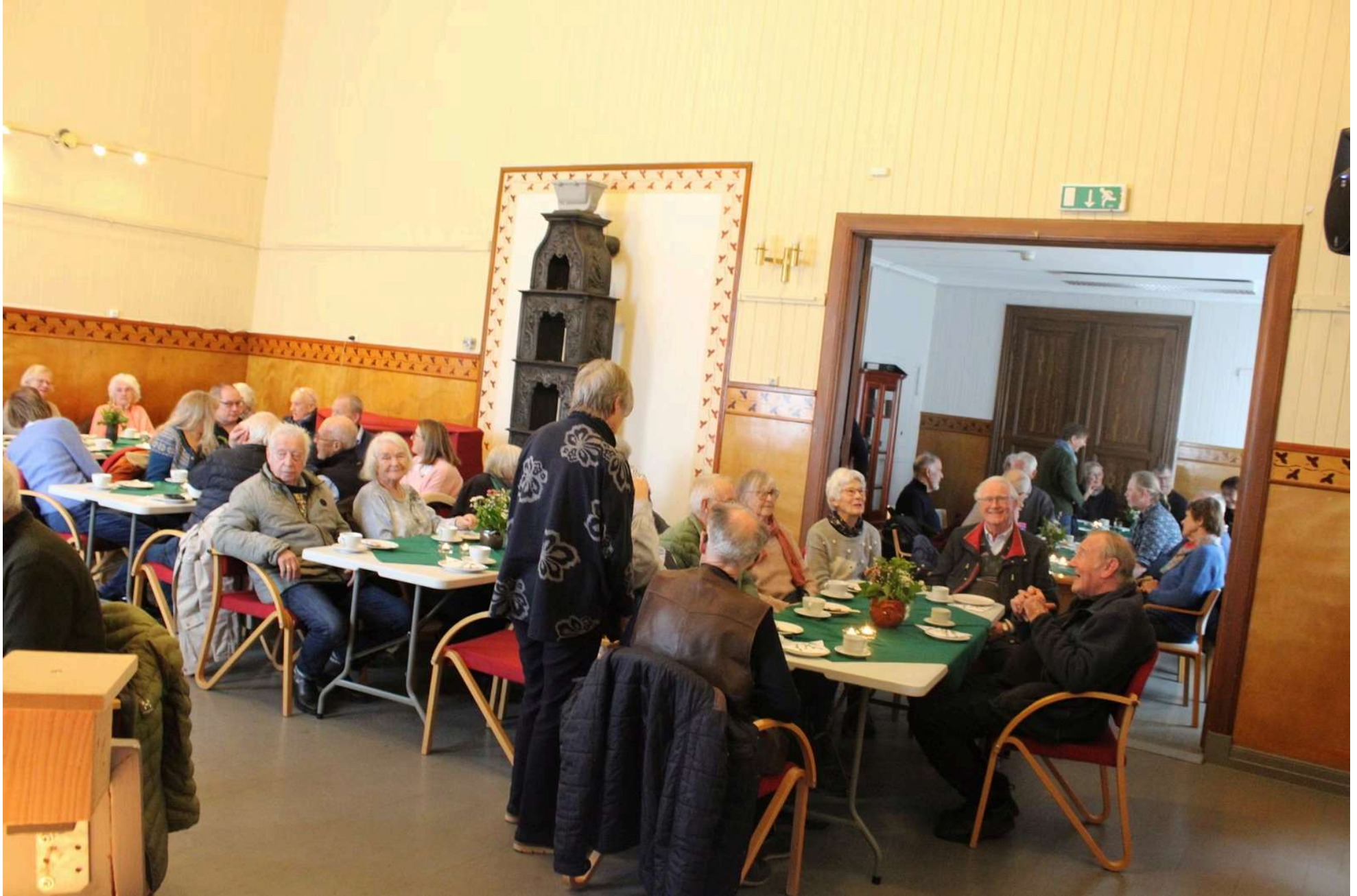
Hovedsalen ble utvidet: Siden antall besøkende var rekordhøyt måtte flere stoler og bord dekkes i bisalen.